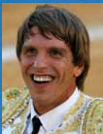
MANUEL DIAZ "EL CORDOBÉS"